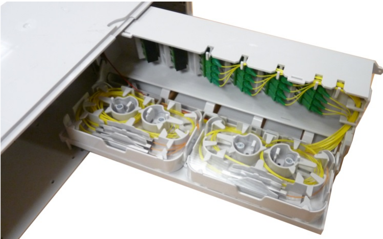
Domino Splitting & Patching: view of cassette to splice trunks of splitters (compatible G652 fibre, up to 12 splices)